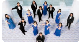
びわ湖ホール声楽アンサンブル