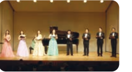
びわ湖ホール声楽アンサンブル