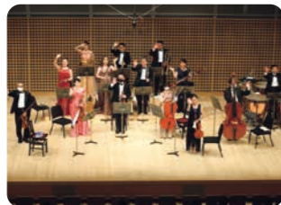
京都フィルハーモニー室内合奏団

ロッシェニ:オペラ「ウィリアム・テル」序曲より スイス軍の行進 フンパーディンク:オペラ「ヘンゼルと グレーテル」より 踊りましょうよ アンダーソン:シンコペーテッド・クロック ポーランド民謡:クラリネット・ポルカ 谷口國博:バスにのって オフエンバック:オペレッタ「月世界旅行」より ギャロップ