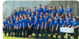
滋賀県高等学校合同合唱団