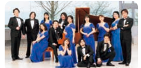
びわ湖ホール声楽アンサンブル