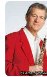
ハンスイェルク・シェレンベルガー

シューマン:3つのロマンス op.94 J.S.バッハ:オーボエ・ソナタ 短調 BWV 1030b クララ・シューマン:3つのロマンス op.22