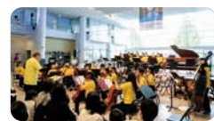
さくらジュニアオーケストラ